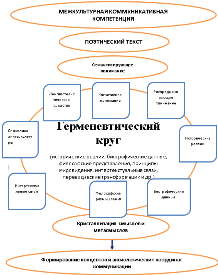
Рис. 1. Формирование межкультурной коммуникативной компетенции на материале поэтического текста.

низации 289 , что требует детального рассмотрения и способствует глубинному постижению языковых структур. Взаимодействие гармонии и герменевтики в пространстве герменевтического круга способствует углублению понимания на каждом витке круга и формированию межкультурной компетенции. В результате процесс формирования межкультурной коммуникативной компетенции на материале поэтического текста можно представить в виде схемы (Рис. 1).