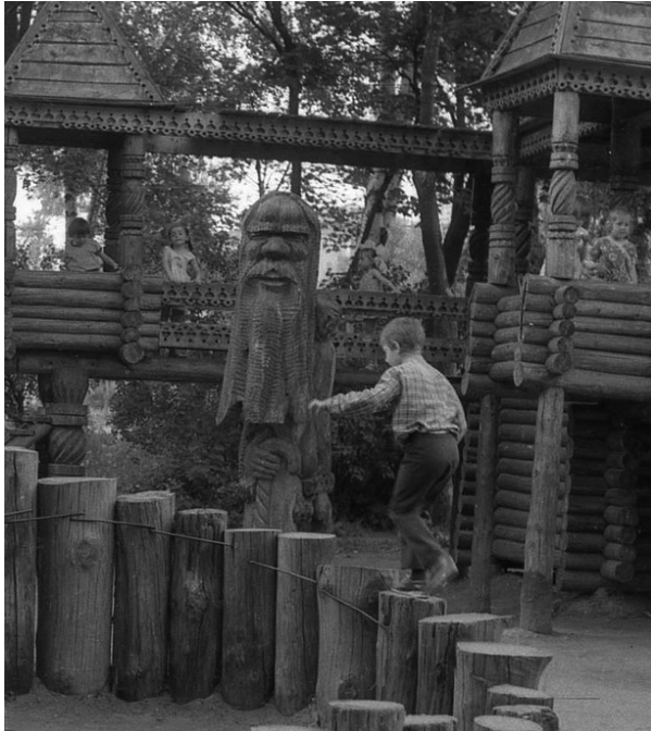
Парк имени Фейгина в Рыбинске.