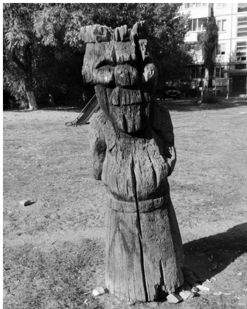
Один из уцелевших объектов детского городка в Волгограде. Конец 1970-х — начало 1980-х гг.